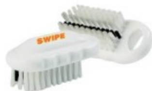
CEPILLO PARA MANOS Y UÑAS