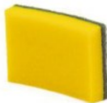
FIBRA VERDE CON ESPONJA