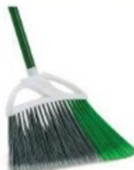
ESCOBA DOMÉSTICA 12"