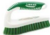
CEPILLO TIPO PLANCHA