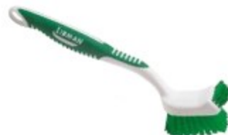
CEPILLO PARA COCINA