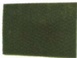
FIBRA VERDE MEDIANA