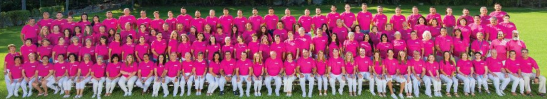
Seminario de Distribuidores 2021. Huatulco, Oaxaca.