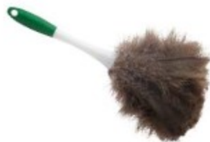
SACUDIDOR DE PLUMAS

Bastón ajustable hasta 2.13m Cabezal flexible 45.7cm