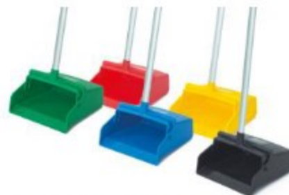
RECOGEDOR DE BASTÓN