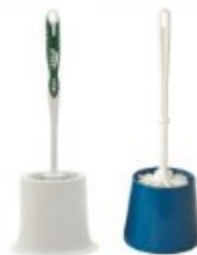
CEPILLOS PARA W.C. C/BASE