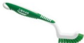
CEPILLO PARA EMBOQUILLADO