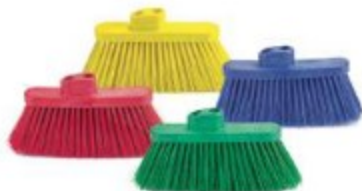
ESCOBA CODIGO DE COLOR