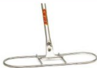
BASE METÁLICA P/MOP SECO