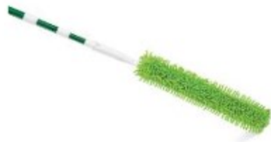
SACUDIDOR ABANICO DE TECHO

Bastón ajustable hasta 2.13m Cabezal flexible 45.7cm