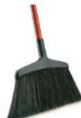
ESCOBA INSTITUCIONAL 15"