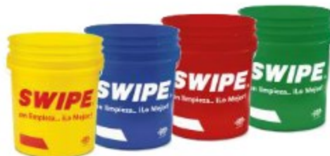
CUBETA VACÍA SWIPE