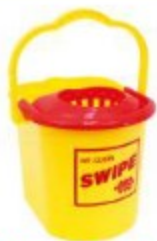
CUBETA CON EXPRIMIDOR