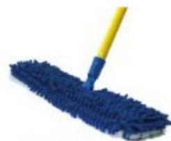
SACUDIDOR DE MICROFIBRA 2 EN 1

Largo: 1.29m Ancho: 42cm Repuesto de microfibra