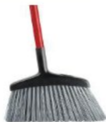
ESCOBA USO RUDO